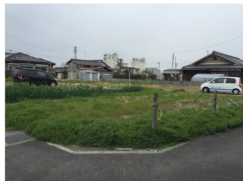
住居建物・倉庫・駐車場など用途色々!! 約21坪の更地! 建築条件無し!